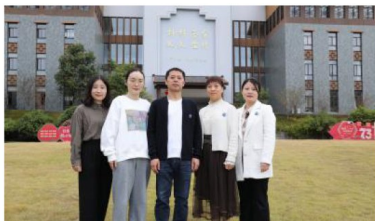
空谷幽香八年级备课组