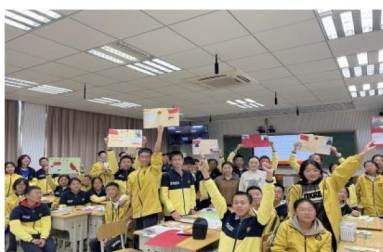
骨干教师上名著导读课