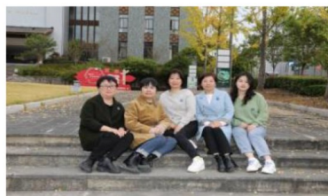
高山景行九年级备课组